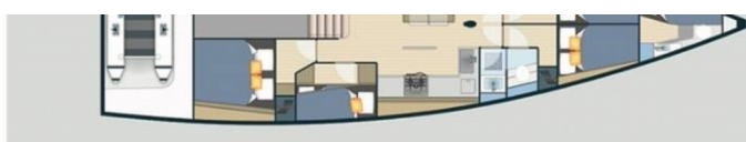
5 double Cabins+crew cabin & Garage