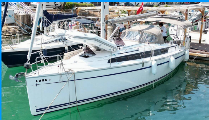
LUNA 2 Bavaria 34 Cruiser

Plachetnica Bavaria Cruiser 34 „Luna 2“, postavená v roku 2023, kotví v Fethiye, Marina Imbat, – Turecko . Jachta má 2 kajút, môže ubytovať 4 osôb a disponuje 1 toaletami/sprchami.