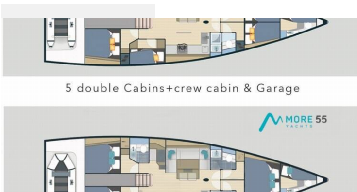
5 double Cabins+crew cabin & Garage