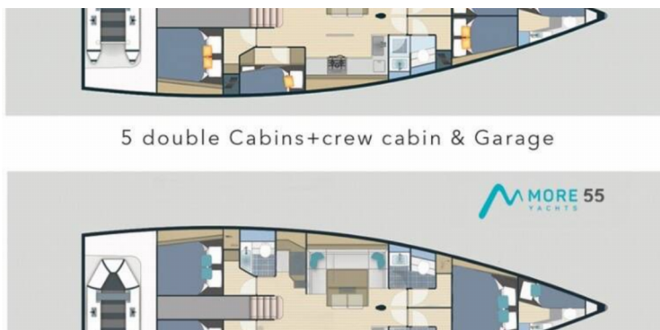
5 double Cabins+crew cabin & Garage