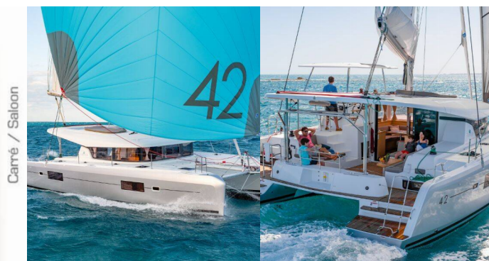
Carré / Salon