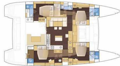
Version 5 cabins / 5 cablara version