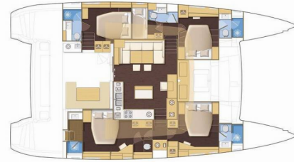
Version 5 cabins / 5 cablara version