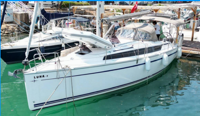
LUNA 2 Bavaria 34 Cruiser

El Velero Bavaria Cruiser 34 „Luna 2“, construido en el año 2023, está amarrado en Fethiye, Marina ImbatFethiye, Marina Imbat, - Turquía. El yate tiene 2 cabinas, puede alojar a 4 personas y tiene 1 baños/duchas.