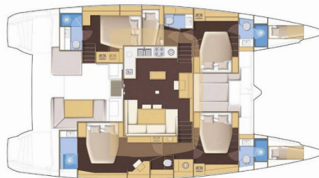
Lagoon 52 version 5 cabins - 5 cabins version