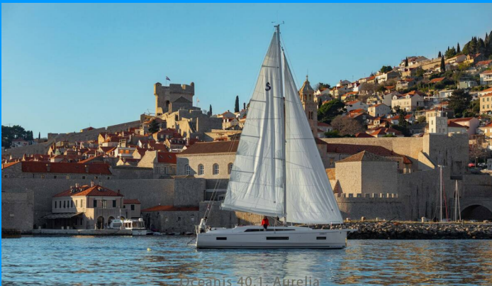
Oceanis 40.1, Aurelia

Die Segelyacht Oceanis 40.1 „Aurelia“, gebaut im Jahr 2022, ist im Dubrovnik, Komolac, ACI Marina Dubrovnik, - Kroatien festgemacht. Die Yacht verfügt über 3 Kabinen, bietet Platz für 6 + 1 Personen und hat 2 Toiletten/Duschen.