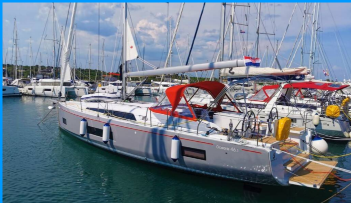
OCEANIS 46.1 - layout 4 CABINS & 2 HEADS

Plachetnice Oceanis 46.1 „Nauti Buoy“, postaveno v roce 2021, je kotveno v ACI Marina Split, Split – Chorvatsko. Jachta má 4 kajuty, může ubytovat 8 + 2 osob a má 2 toalet/sprch.