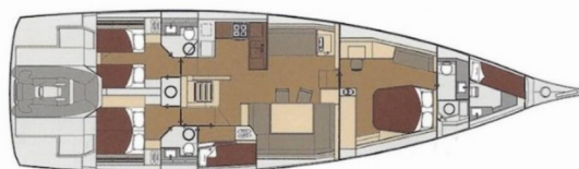
Dufour 63 Exclusive