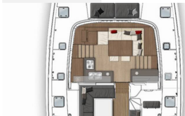
arré et cockpit / Saloon and cockpit