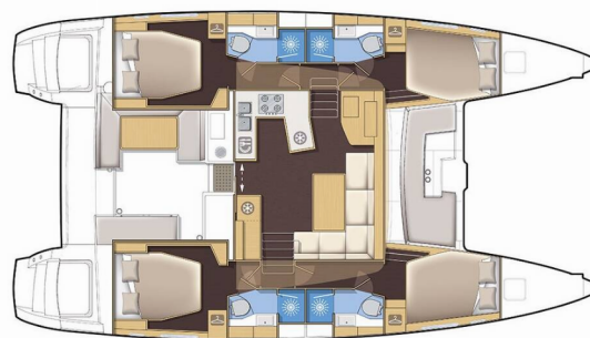
Version 4 cabins / 4 cabin version